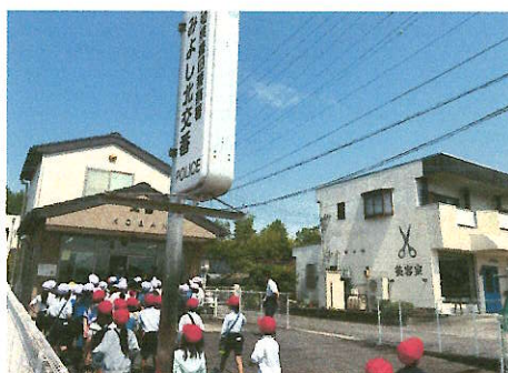
学校の周りの様子