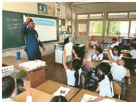
外国語 自己紹介をしよう