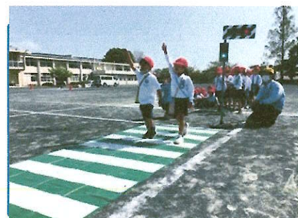
<交通安全教室の様子>

また、生活のリズムが狂いやすくなるのもこの時期です。昨年度は5月から急に気温が上がり体調を崩す児童も増えました。お子様の生活リズムや体調管理に注意していただけるとありがたいです。