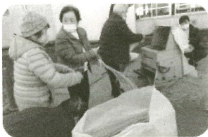
田んぼ学習サポート

地域の方に教えて頂きながら、お花や野菜を植えています。毎週水曜日はグリーンボランティアの子どもたちも一緒に畑の手入れを楽しみ、正課クラブの授業でも活用しています。