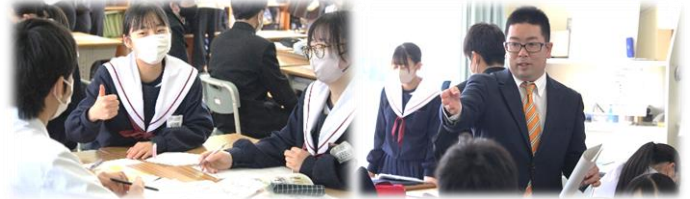
◆個で学び、途中で学び合う、楽しくわかる授業をめざします

22日、授業参観では授業を通して、担任・担当学級への思いを、学年保護者会では学年主任を中心に学年への思いを伝えました。お忙しい中、学校での子ども様を見て、熱心に教員からのお話を聞いていただき、ありがとうございました。