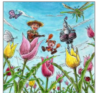
絵・文 校長：吉田祐示

『たくましく、うるわしく、かがやかしく』、そんな子どもたちの姿を思い描き、“チーム三好中”を合言葉に、一人一人の持ち味“色”が輝き、優しく温かい学級・学年の、“彩り”があふれる三好中を、保護者・地域の皆様とともに創っていきたくと思います。一年間よろしく願いいたします。