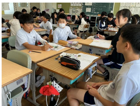
国語：グループでの朗読発表