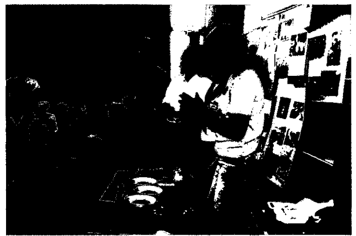
↑トルシーダ（日本語教室）の中学生から ブラジルの文化を学ぼう