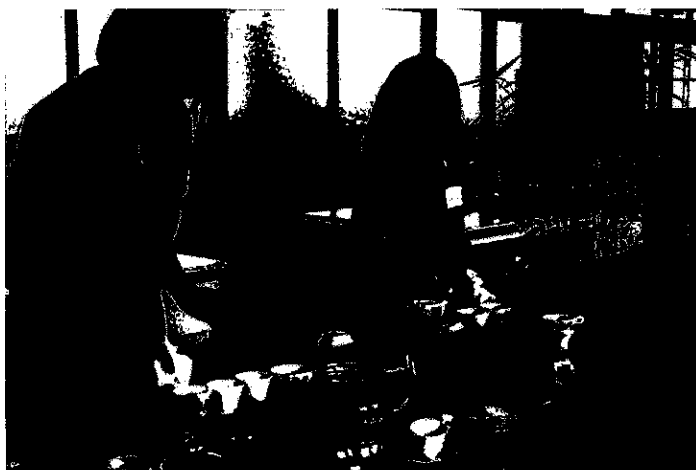
↑中国茶体験。本格的な作法を学びました。