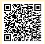
「ラーケーションの日」活動例