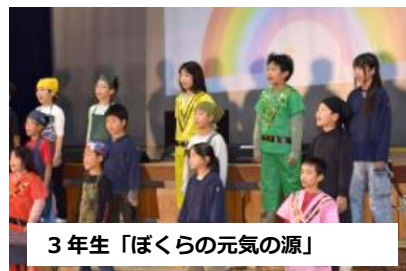
3年生「ぼくらの元気の源」