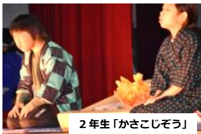
2年生「かさこじぞう」