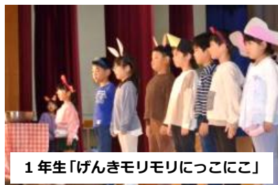
1年生「げんきモリモリにっここ」

学芸会では、多くの来賓の方々からお褒めの言葉やねぎらいの言葉をいただきました。誠にありがとうございます。そして、保護者の皆様からの温かい拍手で子どもたちは充実感を味わうことができました。これからの学校生活にも自信をもって一生懸命取り組んでいくと思います。子どもたちのがんばりをこれからももしっかり支えていきます。今後ともよろしくお願いたします。