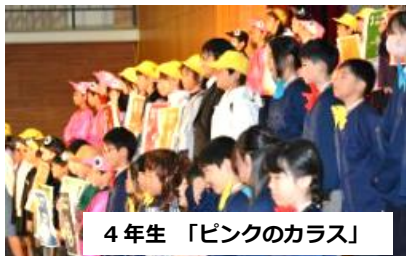
4年生「ピンクのカラス」