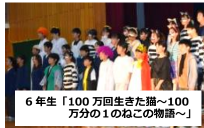
6年生「100万回生きた猫～100万分の1のねこの物語～」