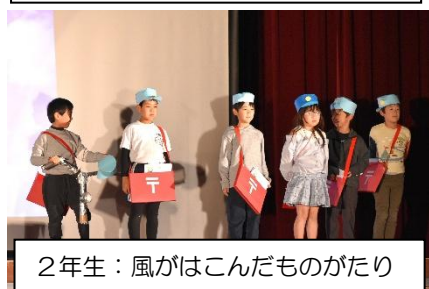
2年生：風がはこんだものがたり