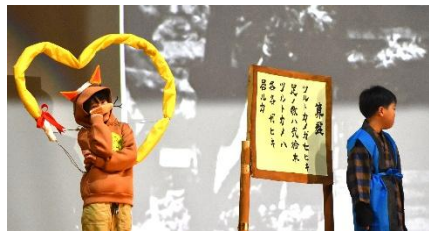
3年生：にゃんぷのみよし歴史探検記