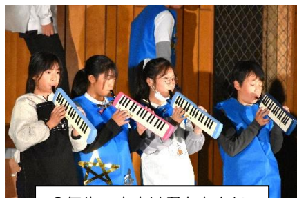
6年生：未来は君とともに