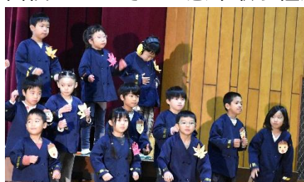
1年生：わくわくきらきら一年生

学芸会では、多くの来賓の方々からお褒めの言葉やねぎらいのお言葉をいただきました。誠にありがとうございます。そして、保護者の皆様からの温かい拍手で子どもたちは充実感を味わうことができました。学芸会を通して学んだことをこれからの学校生活にも生かし、自信をもって一生懸命取り組んでいくことを楽しみにしています。