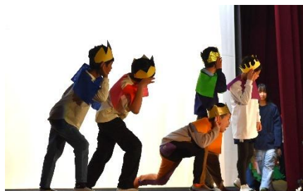
5年生：世界でいちばんやかましい音