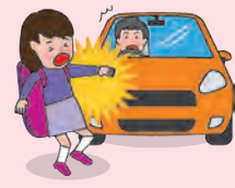
● 団体活動への往復中、車にはねられてケガをした場合