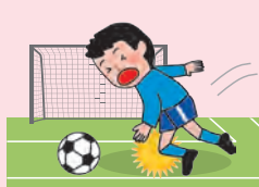
● 団体活動中のケガ

※AW・BW・CW区分にご加入の場合は、上記に加え、「団体での活動中およびその往復中」以外の事故も対象となります。ただし、熱中症、細菌性・ウイルス性食中毒を除きます。